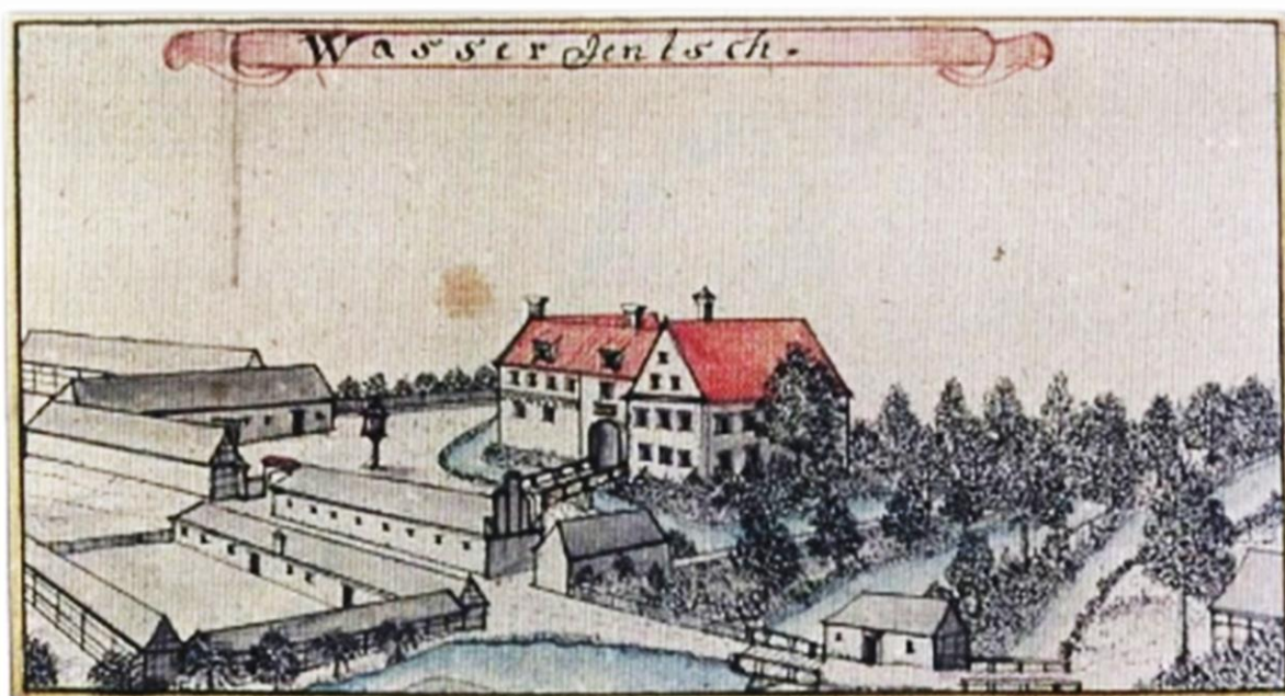
Dwór obronny Rodu von Kaltenbrunn w Komorowicach – widok wg. F.B. Wenera z połowy XVIII w.

Niestety ze względu na zmiany organizacyjne ówczesny właściciel - Przedsiębiorstwo Zaopatrzeniowo-Handlowe Zespołu Elektrociepłowni Wrocław Sp. z o.o. zaprzestał realizacji jakichkolwiek prac, w tym bieżącego utrzymania i ochrony fizycznej obiektu.